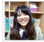
じゃすみん WEBデザイナー

もちろん、メインとなるiOSも最新のもの!・・・そう、最新のものだからこそ、スマイルの動作状況の確認は皆さまで同じタイミングから始まるのです。(これは他のアプリやシステムなども同じです)ですので、もし「7で見ると変になる!」ってことがありましたら、お気軽にご連絡ください!随時対応していきます!