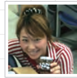
のーちゃん WEBデザイナー

また、リウムスマイル!は、皆様の使い勝手向上のために日々改良を続けていきます!操作について何かお気づきの点やご不明な点等ございましたら、いつでもお問合せお待ちしております。