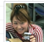
のーちゃん WEBデザイナー

また、リウムスマイル!は、皆様の使い勝手向上のために日々改良を続けていきます!操作について何かお気づきの点やご不明な点等ございましたら、いつでもお問合せお待ちしております。