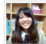
じゃすみん WEBデザイナー

です。(Yahoo!はずいぶん前にサービス終了したようです)ただ申請してもすぐに表示されるようになるわけじゃありません。気長に待ちながら、SNSなどでホームページができたことをお知らせしましょう。