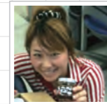
のーちゃん WEBデザイナー